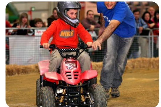
QUADS (4X4 OCIOAVENTURA)