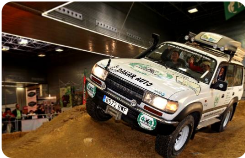
PASEO EN 4X4 (4X4 OCIOAVENTURA)