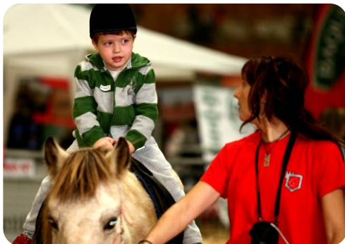
HIPICA (CLUB HIPICO BUTRON)