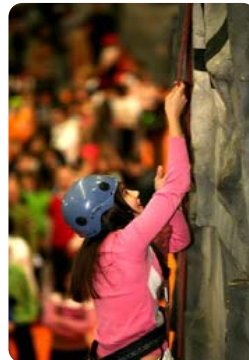
ROCODROMO Y PUENTE TIBETANO (HULU)