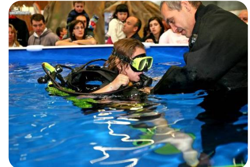
CURSO INICIACION BUCEO (FEVAS)