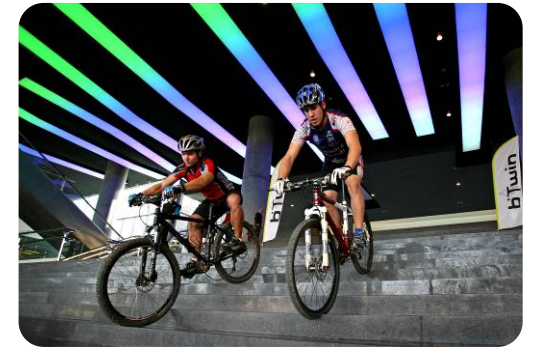
EXHIBICIONES BTT (DECATHLON)