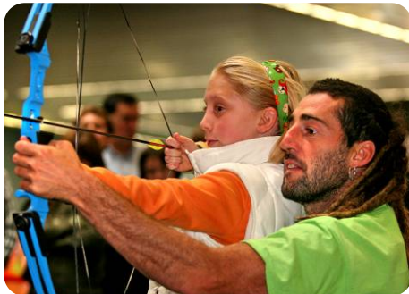
TIRO CON ARCO (TROKA)