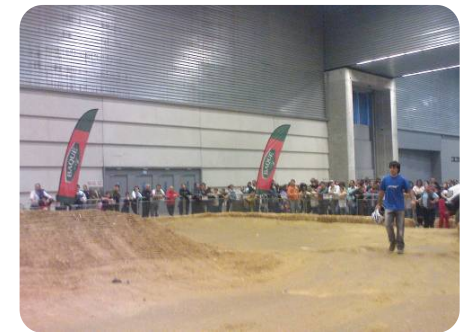
PISTA DE TIERRA (4X4, QUADS, BTT)