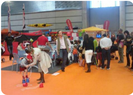
TALLER DE NIÑOS (PINPOIL OCIO)